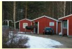
Neugieriger Elch besucht Hütte