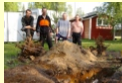
Eine Baumwurzel verschwindet

Nachdem im April der Schnee den ersten Frühlingsblumen wick begannen wir unsere diesjährige Frühjahrsrenovierung und -verbesserung. Neu in diesem Jahr: Das Servicegebäude hat einen neuen Anstrich sowie eine neue Infotafel, es gibt eine Mountainbike-Wegenetz von 160 km Länge, verbesserte Angelausrüstungen mit Elektromotor, Echolot und eigenem Angelshop sowie Camping 45 - Souvenirs (Baseballkappen, T-Shirts und eigene Postkarten). Des weiteren sind vier Stellplätze begrünt worden.