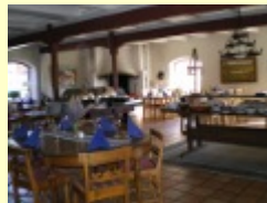
Restaurant Sahlströmgården - ein Erlebnis!

An dieser Stelle fügen wir während des Sommers sporadisch neue Bilder ein. Bis dato hatten wir einen schönen Sommer, im Juni sehr trocken und im Juli regnerisch. Besonders viele Gäste besuchten uns dieses Jahr - wir hatten fast jeden Monat Besucherrekord!