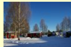
Winterstimmung auf Camping 45