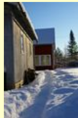
Weg zum Servicehaus