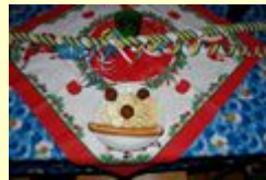
Tellerdeko am Buffet